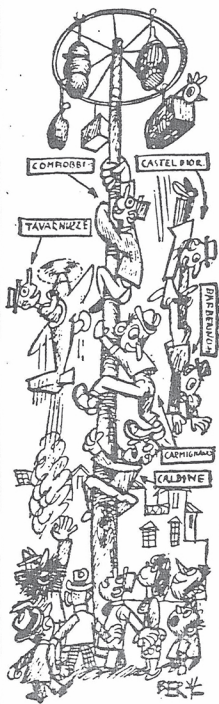
"Toscana Nuova", III, 42, 29 ottobre 1948